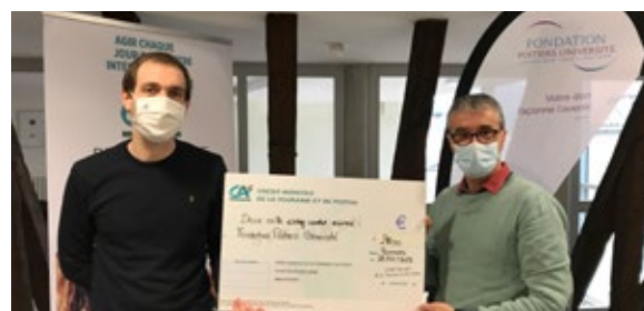
Remise «Episs'Campus 86»