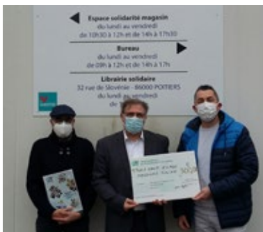
Remise «Secours Populaire 86»