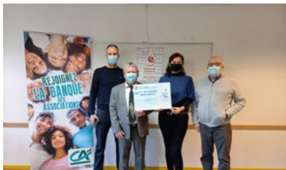
Remise «Planning Familial 37»

Un accompagnement illustrant les valeurs mutualistes : proximité, utilité, solidarité !