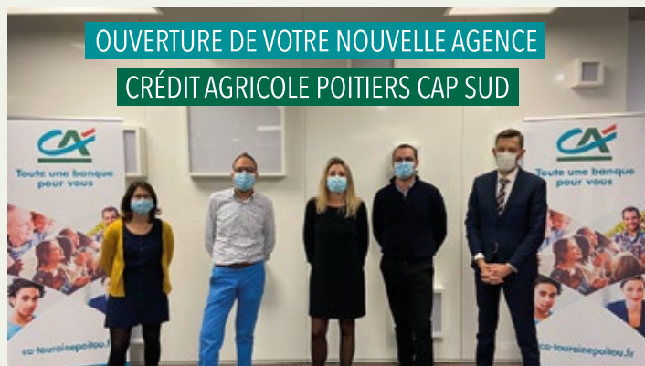
L'Équipe de l'agence CAP SUD

Le Crédit Agricole de la Touraine et du Poitou fait le choix de maintenir un réseau dense sans fermeture d'agence et poursuit ses ambitions 2021 : « Développer la proximité digitale et humaine ». Le 30 novembre la nouvelle agence CAP SUD 100% innovante, 100% conseil, 100% digitale et 100% conquête, a ouvert dans une zone à fort potentiel, avenue du 8 mai 1945 à Poitiers.