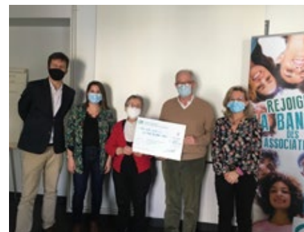
Remise «La Table de Jeanne Marie»