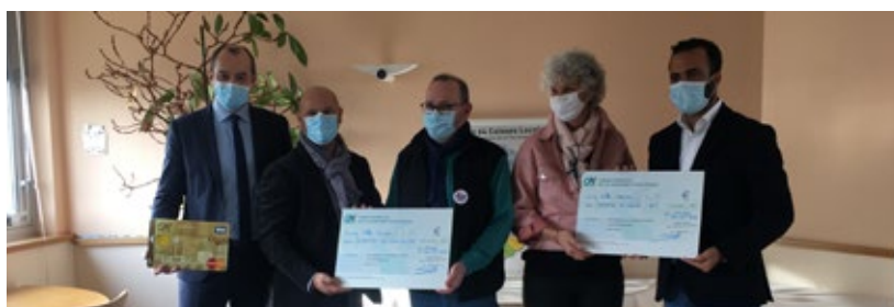
Remise «Les Restos du Coeur 37 et 86»